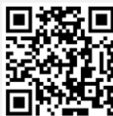
คู่มือและวิดีโอการใช้งานระบบ Inventech Connect

*หมายเหตุ การทำงานของระบบประชุมผ่านสื่ออิเล็กทรอนิกส์ และระบบ Inventech Connect ขึ้นอยู่กับระบบอินเทอร์เน็ตที่รองรับของผู้ถือหุ้นหรือผู้รับมอบฉันทะ รวมถึงอุปกรณ์ และ/หรือ โปรแกรมของอุปกรณ์ กรุณาใช้อุปกรณ์ และ/หรือโปรแกรมดังต่อไปนี้ในการใช้งานระบบ